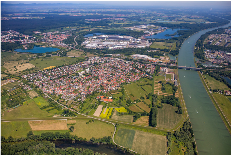
Luftbild von Wörth-Maximiliansau (2017)