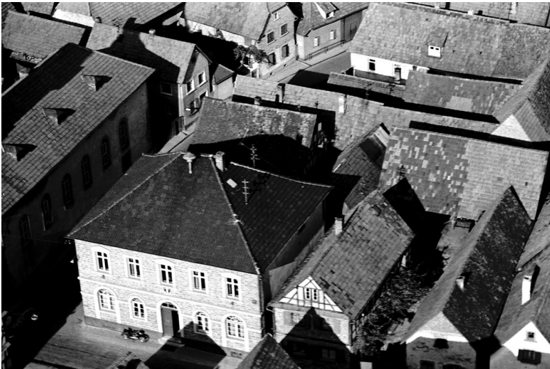
Altes Rathaus Wörth (1950)