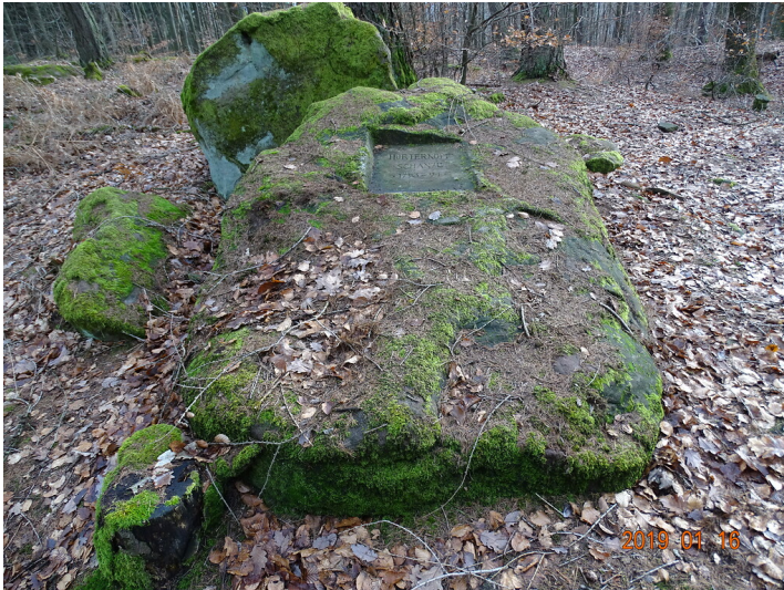
Ritterstein Nr. 145 Horterkopf Schanze 1793-94 nordwestlich von Waldleiningen (2019)