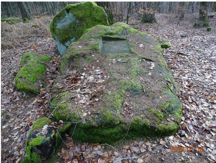
Ritterstein Nr. 145 Horterkopf Schanze 1793-94 nordwestlich von Waldleiningen (2019)