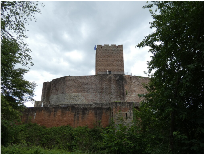
Burgruine Landeck bei Klingenstein (2022)