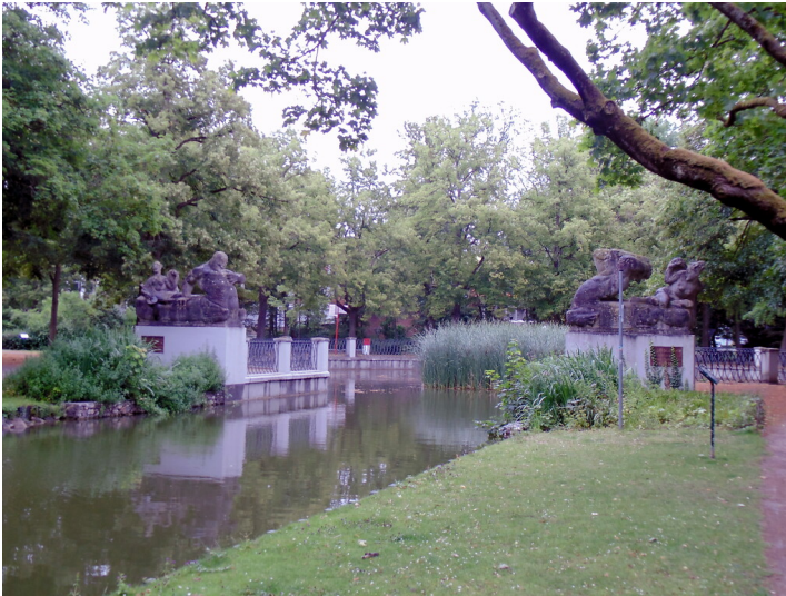
Blick auf die beiden Figuren "Kentaur und Najade" von Eduard Schmitz nach Entwürfen von Georg Grasegger aus dem Jahr 1930. Im Vordergrund mündet der Rautenstrauchkanal in das Rundbecken im Bereich des Karl-Schwering-Platzes (2020). die beiden Figuren "Kentaur und Najade" von Eduard Schmitz nach Entwürfen von Georg Grasegger aus dem Jahr 1930. Im Vordergrund mündet der Rautenstrauchkanal in das Rundbecken im Bereich des Karl-Schwering-Platzes (2020).