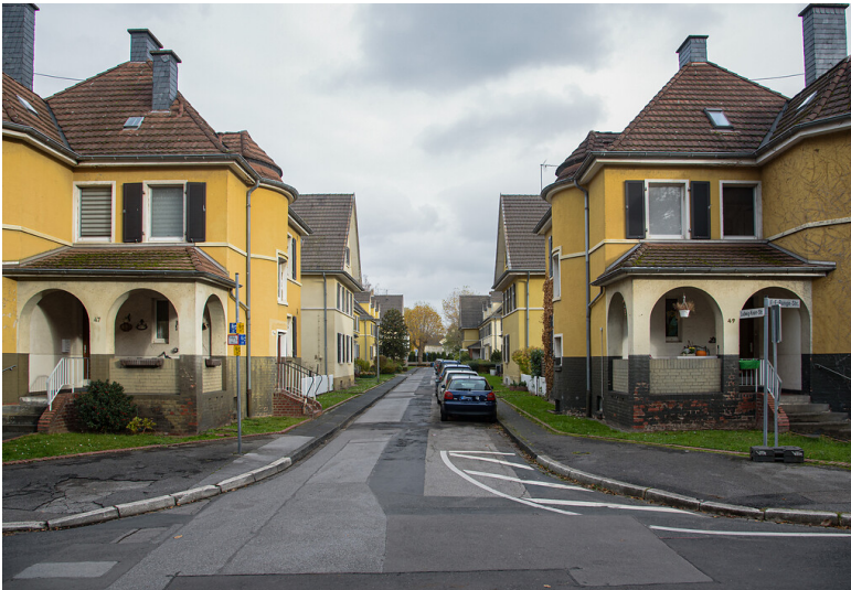
Siedlung Kolonie III an der Ludwig-Knorr-Straße (2021)