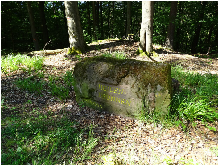
Ritterstein Nr. 142 "Heiden=Brunnen 100 Schr." nordwestlich von Esthal (2019)