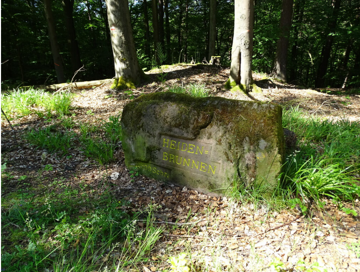
Ritterstein Nr. 142 "Heiden=Brunnen 100 Schr." nordwestlich von Esthal (2019)