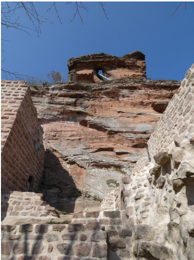
Burgruine Drachenfels bei Busenberg (2022)