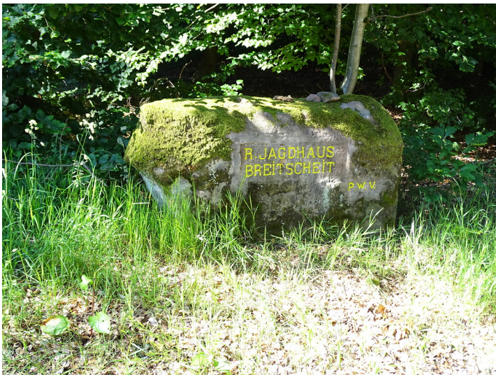
Ritterstein Nr. 120 „R. Jagdhaus Breitscheit“ nördlich von Elmstein (2019)