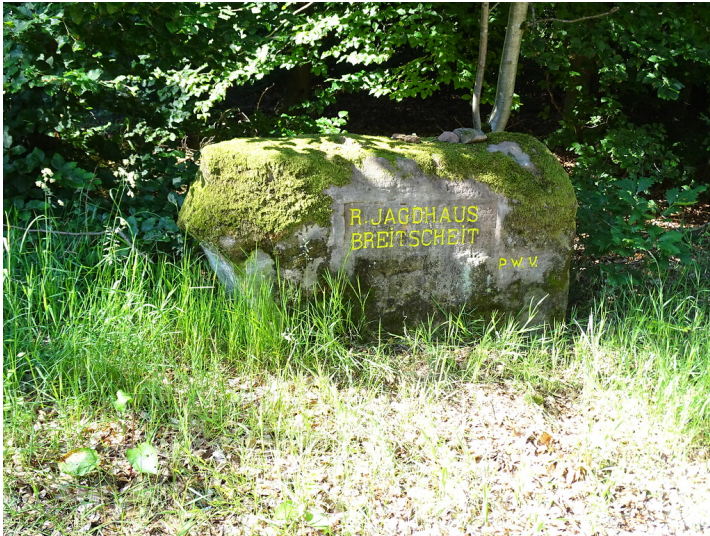
Ritterstein Nr. 120 „R. Jagdhaus Breitscheit“ nördlich von Elmstein (2019)