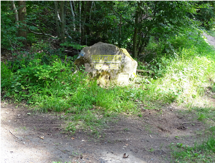
Ritterstein Nr. 118 Dicke Eiche 600 Schr. westlich von Esthal (2019)