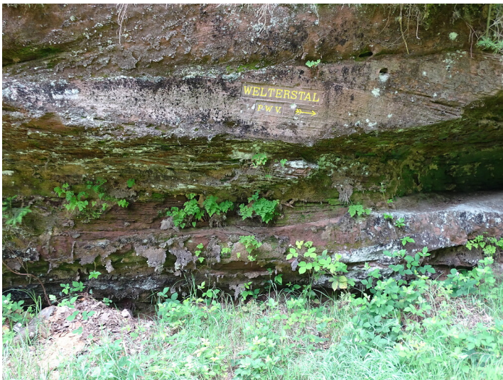
Ritterstein Nr. 109 Welterstal zwischen Elmstein und Johanniskreuz (2019)