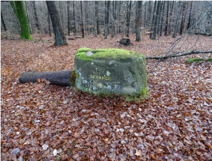
Ritterstein Nr. 81 Schanze 1794 südlich von Johanniskreuz an der B 48 (2018)