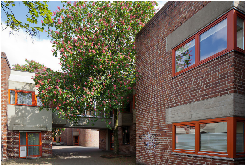
Düsseldorf-Garath, Ricarda-Huch-Str. 2, 6 + 8, Hildegardis-Altenheim