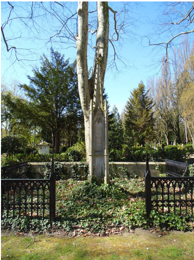
Grabstätte der Familie Joest auf dem Friedhof Melaten (2020)