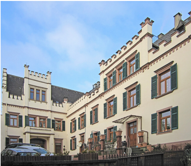
Ehemaliges Weingut Schäfer in Rüdesheim (2011)