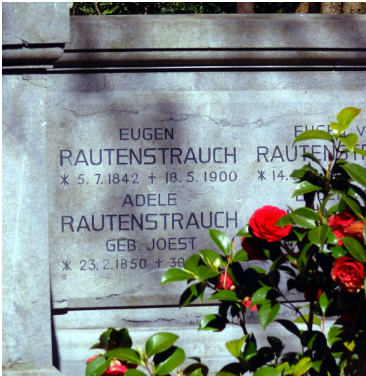
Detailansicht der Grabstätte von Adele Rautenstrauch, Stifterin des Rautenstrauch-Joest-Museums, auf dem Friedhof Melaten (2020).