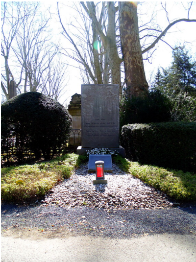
Grabstätte Nicolaus August Ottos auf dem Friedhof Melaten (2020)