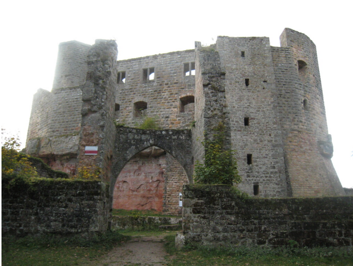
Burg Gräfenstein bei Merzalben (2020)