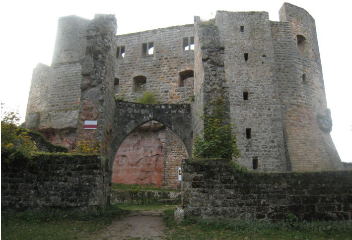
Burg Gräfenstein bei Merzalben (2020)