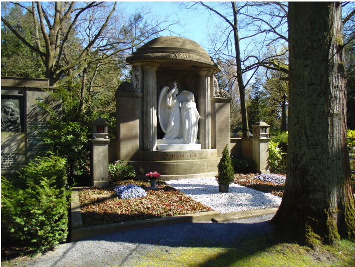
Grabstätte der Brauerei-Familie Früh auf dem Kölner Friedhof Melaten (2020).