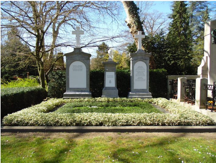
Grabstätte der Familie Imhoff auf dem Friedhof Melaten, bestehend aus drei Stelen (2020)