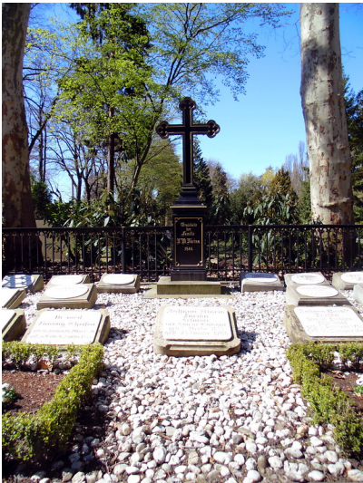
Grabstätte der Destillateursfamilie Farina ("Eau de Cologne") auf dem Kölner Friedhof Melaten (2020).