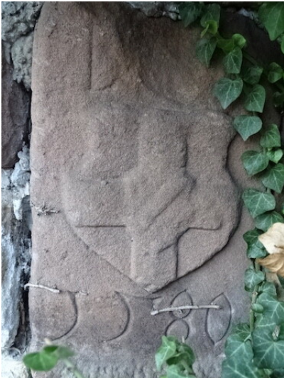
Wappenstein "von Hattstein" Mühlstraße in Alsterweiler (2018)