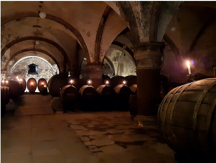
Blick in den Cabinetkeller im Kloster Eberbach (2020)