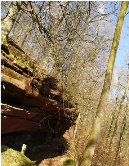
Gerstenfelsen bei Waldfischbach-Burgalben (2020)