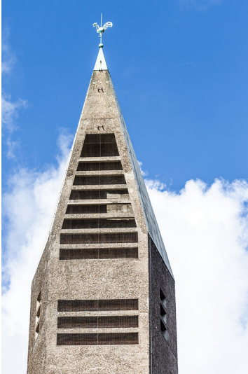
Glockenturm der Pfarrkirche St. Gertrud in Köln-Neustadt (2019)