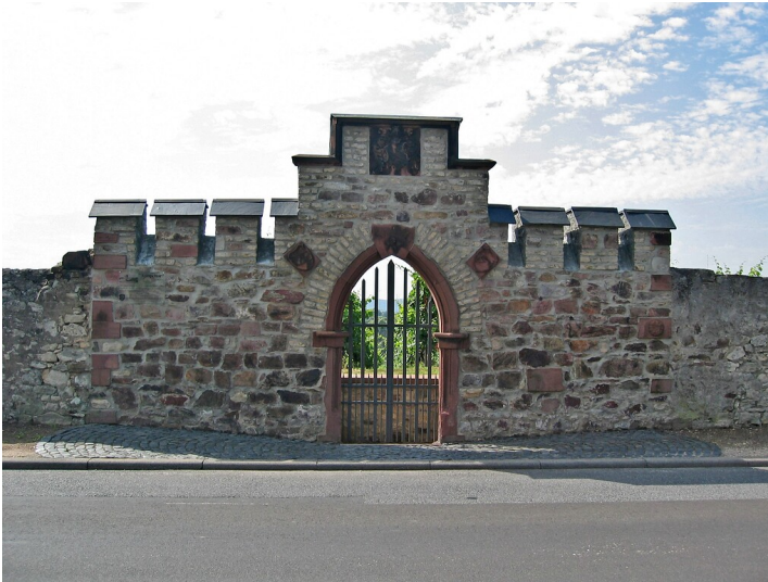
Tor zum Weinberg Pfaffenberg (2004)