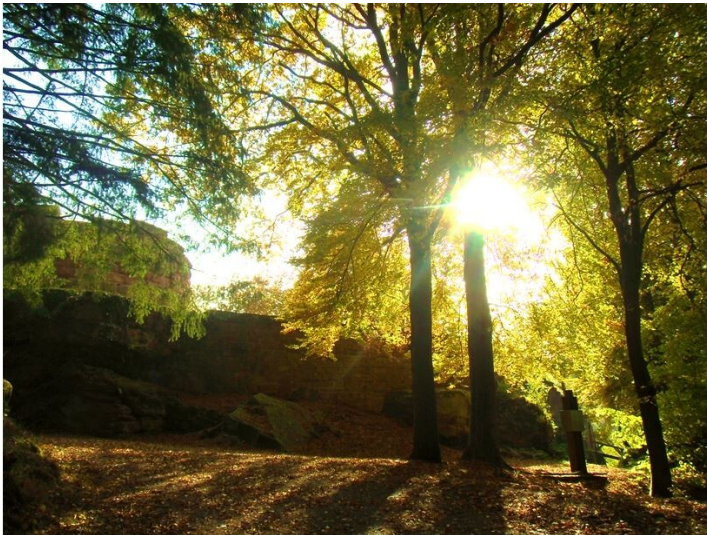
Steinenschloss bei Thaleischweiler-Fröschen (2020)