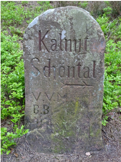
Wegweiserstein "Kalmit Schöntal" am Taubenkopf (2018)