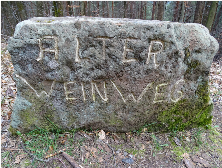
Wegweiserstein „Alter Weinweg“ (2020)