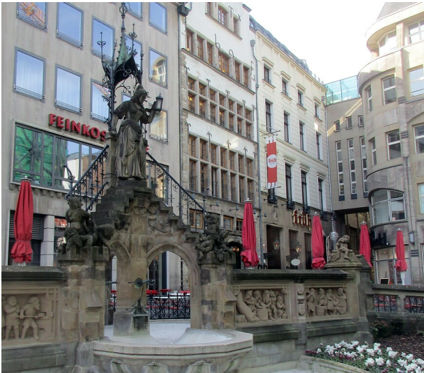
Gesamtansicht des Heinzelmännchenbrunnens in der Kölner Altstadt, im Hintergrund das Kölsch-Brauhaus "Früh" (2020).