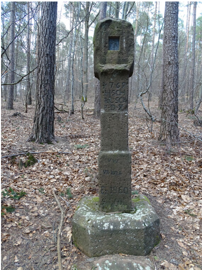
Bildstock am Studerbildkopf (2020)