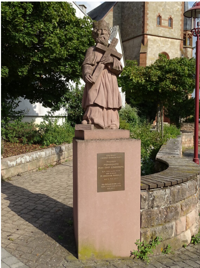
Standbild Johannes Nepomuk Göllheim (2019)