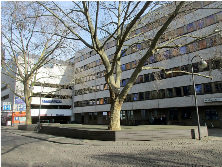
Blick in nördliche Richtung über den Karl-Körper-Platz in Köln-Altstadt-Nord (2020).