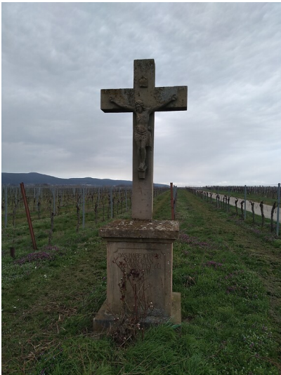
Flurkreuz Woll bei Kirrweiler (2020)