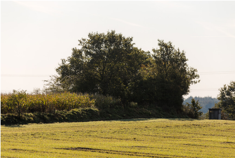
Fotoaufnahme: Ursprüngliche Lage des Dolmens von Frestedt, Herbst 2019