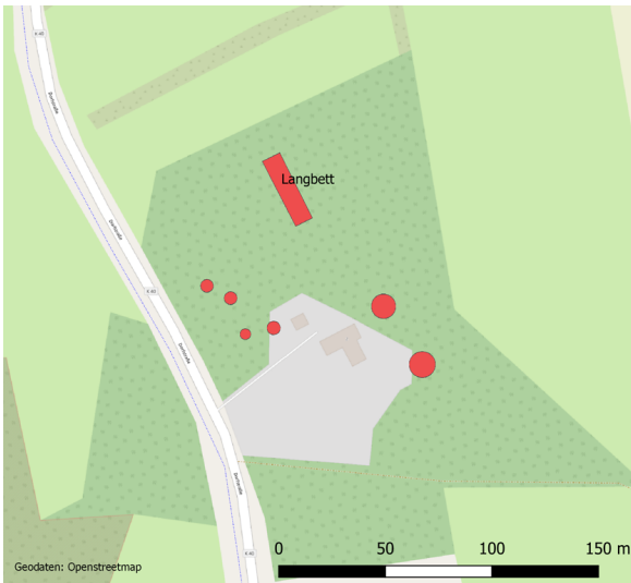
Kartenansicht Lage des Langbetts / Großsteingrabs Schrum LA 11