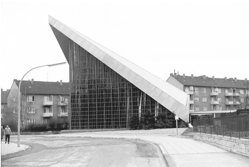
Zeitgenössische Aufnahme des 1965 neu erbauten Gebäudes der evangelischen Stephanuskirche in Köln-Riehl.