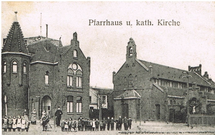
Historische Postkarte aus Köln-Riehl (1920/30er Jahre) mit dem Pfarrhaus und der katholischen Notkirche.