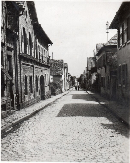
Wohnhaus Hartmannstraße 44 Maikammer (2020)