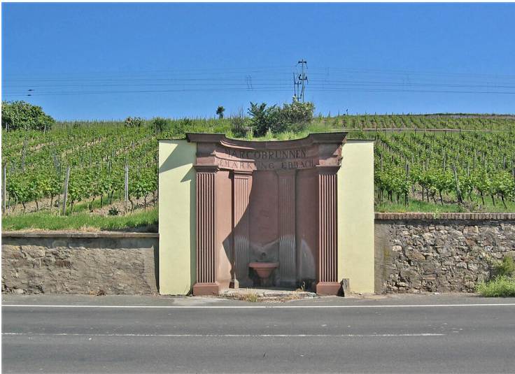
Der Marcobrunnen an der Landstraße zwischen Erbach und Hattenheim (2005)