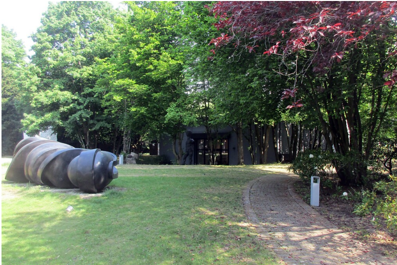
Der Skulpturenpark Köln am Konrad-Adenauer-Ufer in Neustadt-Nord (2020), Blick auf den Bereich der hier einst befindlichen Caponnière des Fort XI des inneren Festungsringes der Stadt.