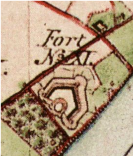
Fort XI im heutigen Inneren Kölner Grüngürtel auf einer historischen Karte von 1845.