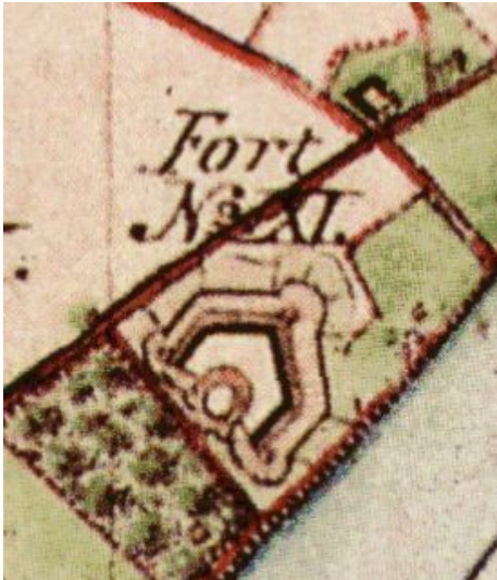
Fort XI im heutigen Inneren Kölner Grüngürtel auf einer historischen Karte von 1845.