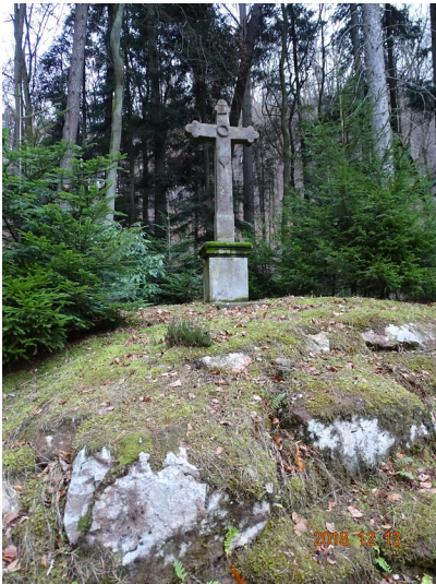
Flurkreuz an der ehemaligen Silbererzgrube Niederschlettenbach (2018)