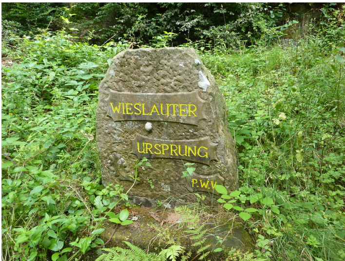
Ritterstein Nr. 230 Wieslauter Ursprung südöstlich von Merzalben (2013)