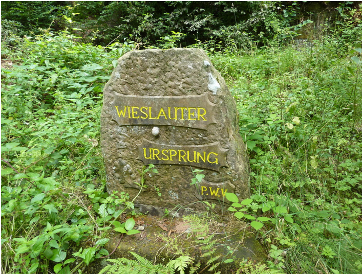
Ritterstein Nr. 230 Wieslauter Ursprung südöstlich von Merzalben (2013)