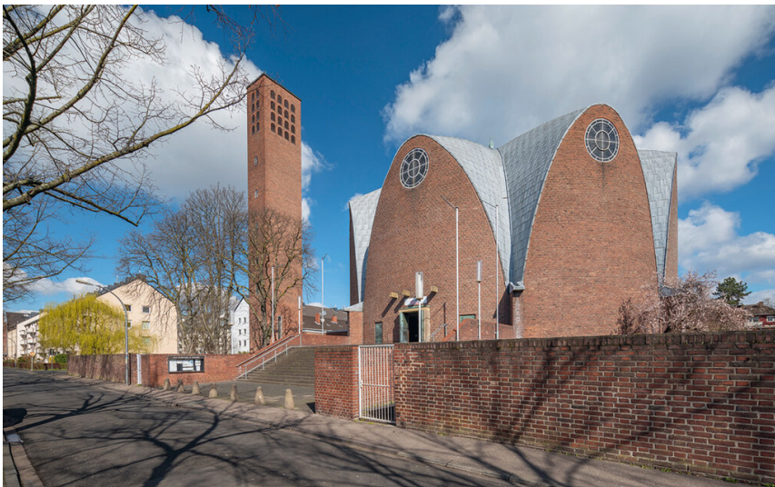
Katholische Pfarrkirche Sankt Engelbert in Köln-Riehl (2022)