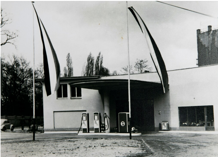
Historische Aufnahme der Tankstelle an der Stammheimer Straße Nr. 9 in Köln-Riehl (1950er-Jahre). Auf den Zapfsäulen ist das Logo der Rheinpreußen-Tankstellen zu erkennen.