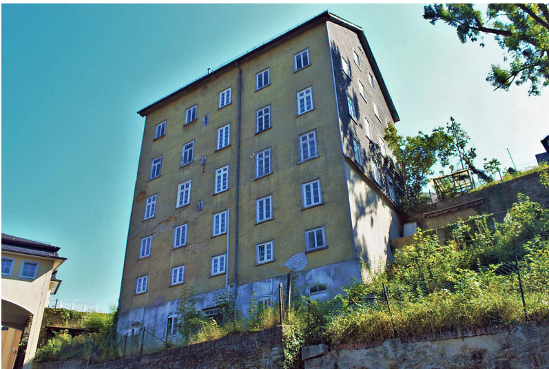
Pisé-Haus Weilburg